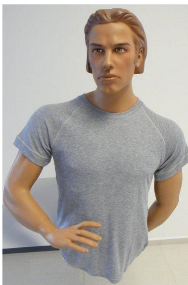
Triko šedé – krátký rukáv – letní 955 – zimní 958