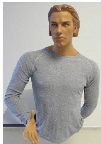
Triko šedé - dlouhý rukáv – letní 956 – zimní 959