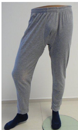
Spodky šedé dlouhé – zimní 957