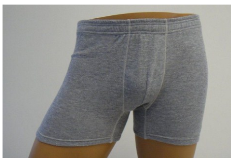
Spodky šedé krátké – letní 954